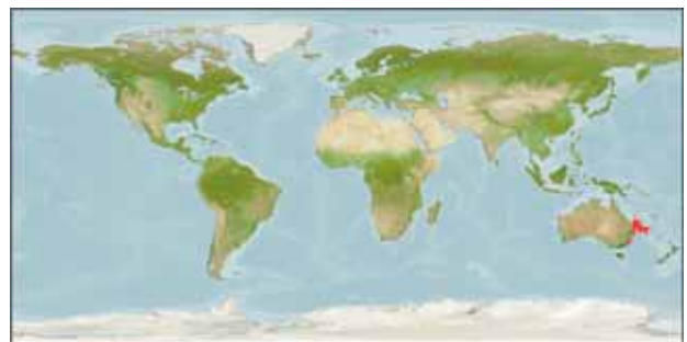
Fig. 2. OBIS におけるクロマグロの検索結果。オーストラリア、台湾、太平洋カナダ沖にしか分布記録が表示されない。